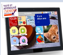
« Ordimemo »