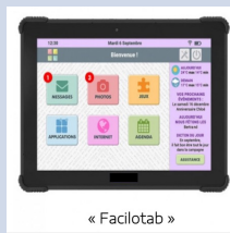
« Facilotab »