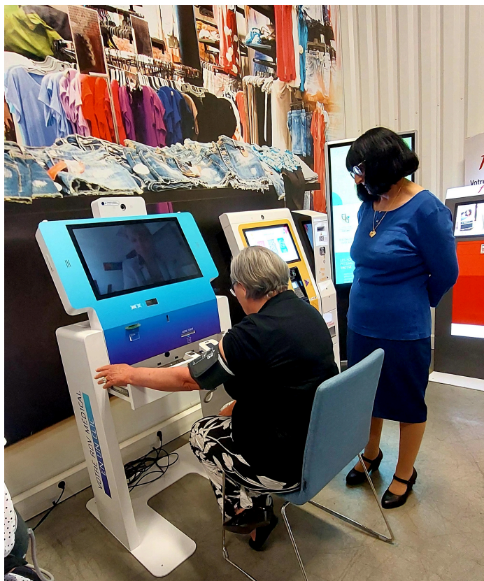
Test d'une borne de téléconsultation avec ses équipements

Un travail pédagogique est à prévoir pour renforcer l'aide à l'identification, la compréhension et l'installation des équipements médicaux.