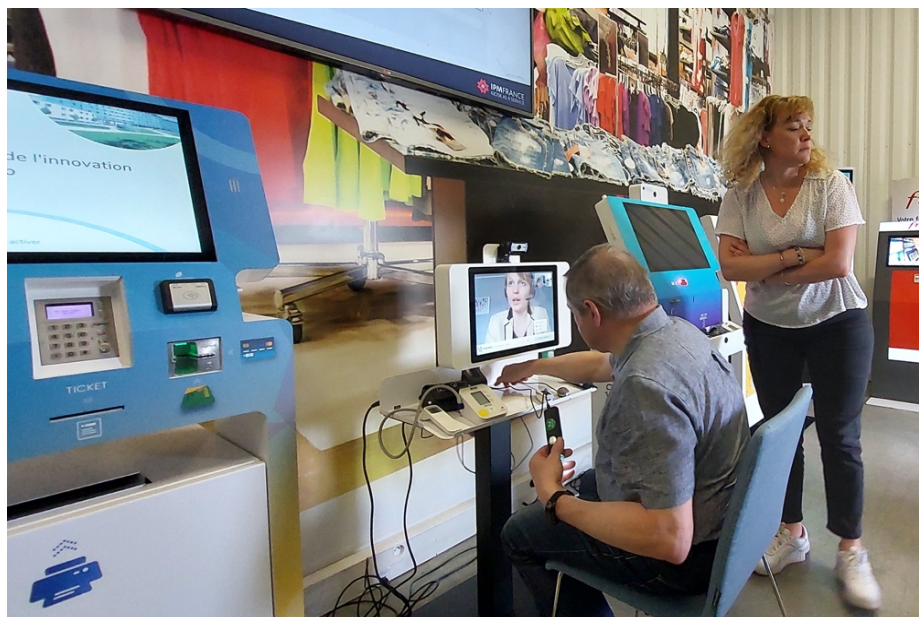
Test de la borne de téléconsultation

C'est une borne multimédia qui permet de naviguer dans un contenu (informations pratiques, catalogue produit...) à l'aide d'un écran tactile ou d'une molette cliquable.